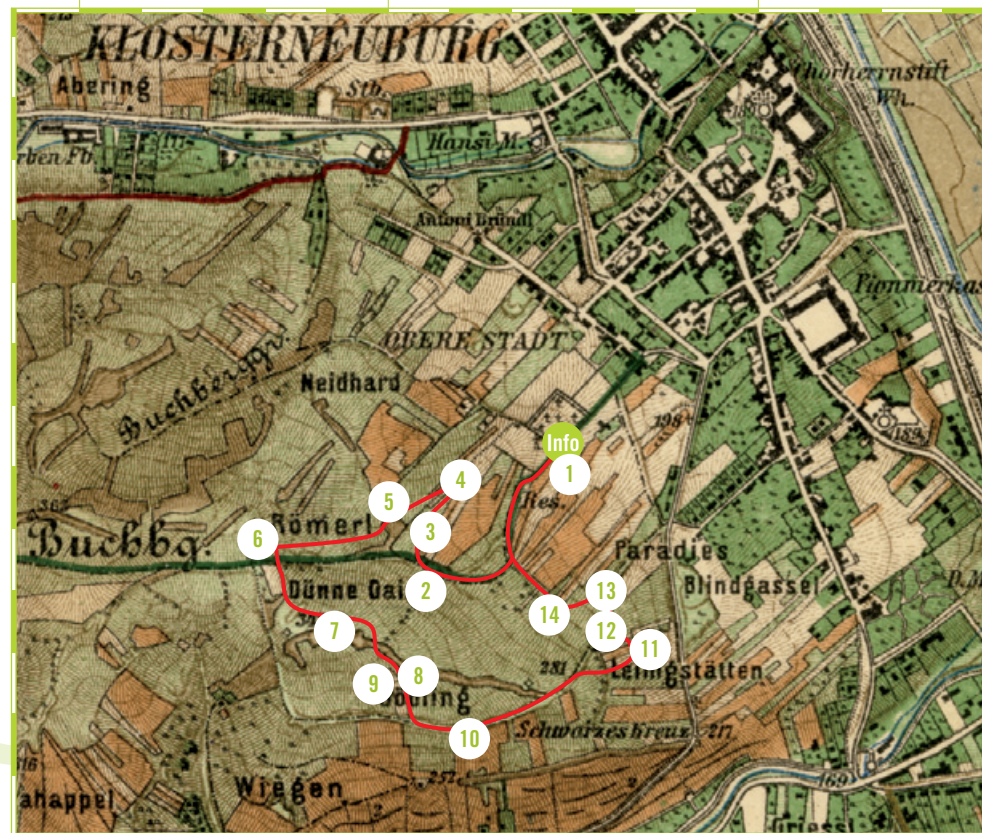
weinhügelwanderweg · Wegweiser ab Start Infostand (Oberer Stadtfriedhof) bzw. Technikum der Weinbauschule (Agnesstraße 60)